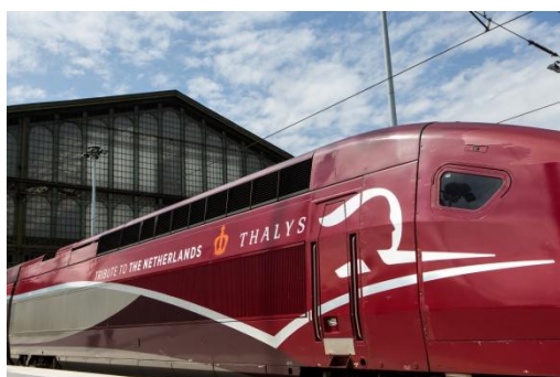
« Tribute to the Netherlands »

Le 30 avril 2013, le prince Willem-Alexander sera intronisé roi des Pays-Bas, à la suite de sa mère, la Reine Beatrix. A l'occasion de cet important événement, Thalys et l'Institut Néerlandais de Paris s'associent pour fêter les Pays-Bas et le futur roi tout au long d'un week-end tout aussi orange que royal.