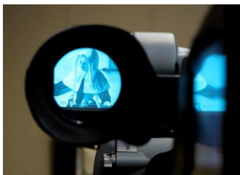
Film Vues sur Vermeer

Accès libre dans la limite des places disponibles, sans réservation.