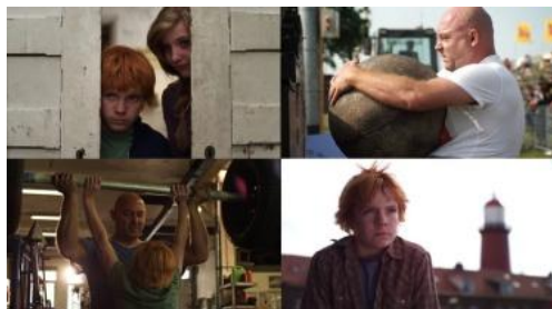
Film L'homme le plus fort des Pays-Bas

12h30 | Brunch typiquement néerlandais. Prix : 10 € par personne Nombre de places limité, sur réservation uniquement