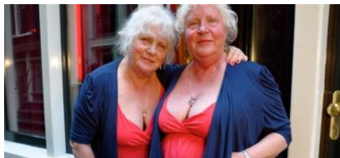
Film Meet the Fokkens

19h00 Rencontre avec les Welcomers Thalys , blogueuses et auteures des « Bons Plans » pour savourer sans modération les villes de Rotterdam et d'Amsterdam.